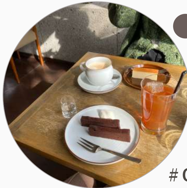
# Cafe Lon