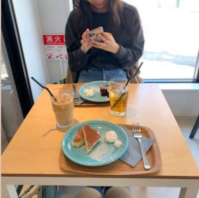
#Baluko Laundry Place